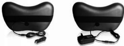
W zestawie zasilacz sieciowy i samochodowy