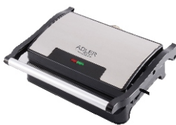
ELECTRIC GRILL AD 3052