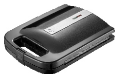
Sandwich Maker AD 3055