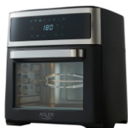
AIR FRYER OVEN AD 6309