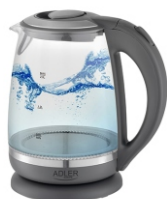
ELECTRIC KETTLE AD 1286