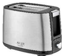
TOASTER 2 SLICE AD 3214