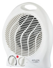
FAN HEATER AD 7728