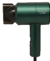
HAIR DRYER AD 2265