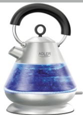
Electric Kettle AD 1282