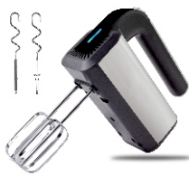
MIXER AD 4225