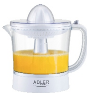
CITRUS JUICER AD 4009