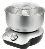
MIXER WITH BOWL AD 4222