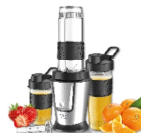
PERSONAL BLENDER AD 4081