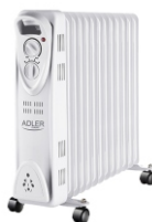
OIL-FILLER RADIATOR AD 7811