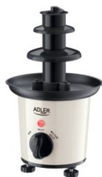
CHOCOLATE FOUNTAIN AD 4487