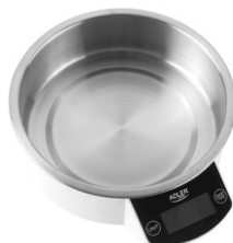
KITCHEN SCALE AD 3166