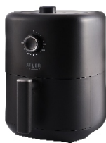
AIR FRYER AD 6310