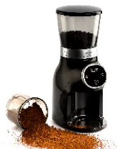
Burr Coffee Grinder AD 4450