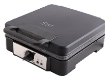
WAFFLE MAKER AD 3049