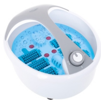
FOOT SPA AD 2177