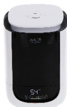
AIR HUMIDIFIER AD 7966