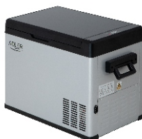
PORTABLE FRIDGE AD 8077