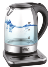
ELECTRIC KETTLE AD 1293