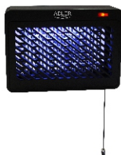
MOSQUITO LAMP AD 7938