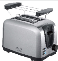
TOASTER 2 SLICE AD 3222