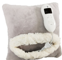
HEATED PAD AD 7412