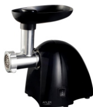
MEAT MINCER AD 4811