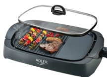
ELECTRIC GRILL AD 6610