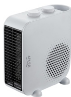
FAN HEATER AD 7725