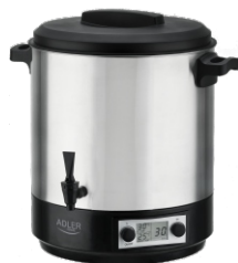
PASTEURIZATION POT AD 4496