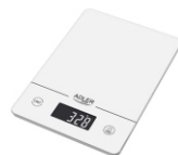
KITCHEN SCALE AD 3170