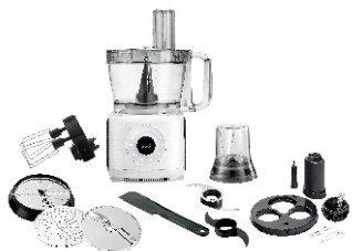
FOOD PROCESSOR AD 4224