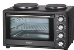
Electric Oven With HOB AD 6020