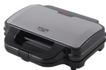
SANDWICH MAKER AD 3043