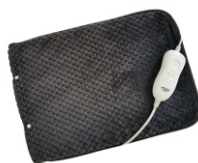
HEATED PAD AD 7433