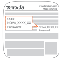
MX12 używany na przykład